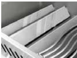
Plaques de brûleur en acier inoxydable à deux niveaux