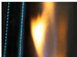
Allumage instantané JETFIRE®