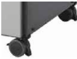
Roulement en douceur avec système de barrure