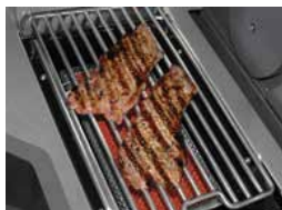
Brûleur latéral SIZZLE ZONE® infrarouge avec grille en acier inoxydable