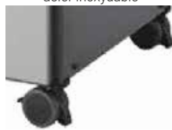
Roulement en douceur avec système de barrure