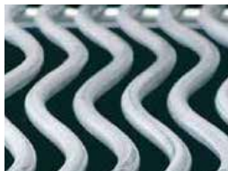
Grilles de cuisson WAVE de 7,5 mm en acier inoxydable