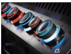
Panneau de contrôle rétro-éclairé Safetyglow.