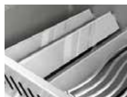
Plaques de brûleur en acier inoxydable à deux niveaux