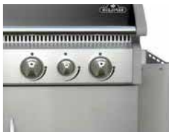
Tablette de travail latérale repliable