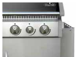
Tablette de travail latérale repliable