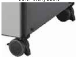
Roulement en douceur avec système de barrure