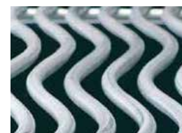
Grilles de cuisson WAVE de 7,5 mm en acier inoxydable