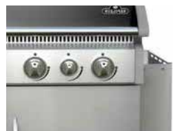
Tablette de travail latérale repliable