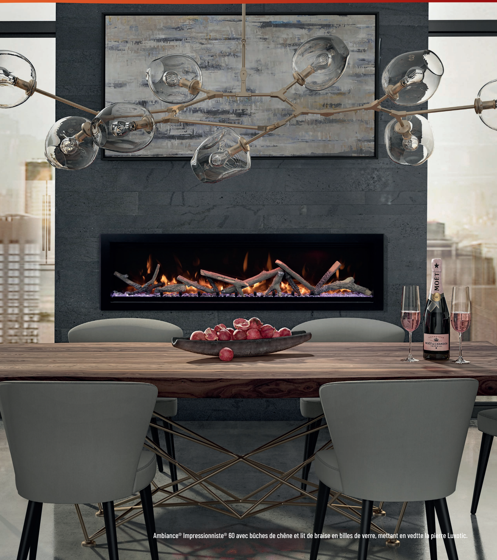
Ambiance® Impressionniste® 60 avec bûches de chêne et lit de braise en billes de verre, mettant en vedette la pierre Luxotic.