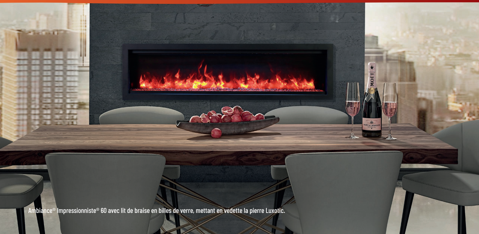
Ambiance® Impressionniste® 60 avec lit de braise en billes de verre, mettant en vedette la pierre Luxotic.